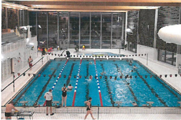
Konkurranse på like vilkår ks.no

Med hilsen Brannforebygg AS Meieriveien 11B, 9700 Lakselv